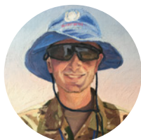
Maler: Peter Carlsen