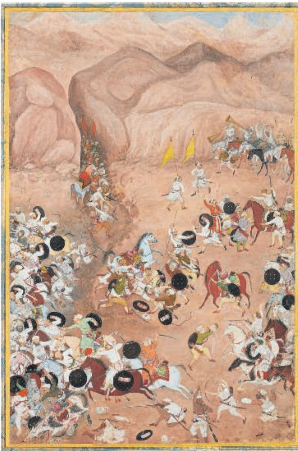
◀ En af de miniaturer, der viser, hvordan våbnene er blevet brugt i store slag. Her vises, hvordan den indiske hinduherker Bikramijit og hans hær (til højre) overvinder den afghanske Darya Khan Rohilla (til venstre). Miniaturen er fra midt i 1600-tallet.

Der er også en hel del uhandy våben i samlingen. Næsten to meter lange geværer, der nærmere kan kaldes en slags mobile kanoner, som har skullet håndledes, antændes med lunte og brugt to typer krud for at fyre af. Mest uhandy er nok den kulle af bjergkrystal, der hænger i udstillingens allersidste rum, og som man nok kunne gokke nogen i nødden med, men måske mest af alt ville være bange for at ødelægge. Vi er kommet til den finere afdeling, der viser, hvordan våbnene også har været et middel til at vise sin status.