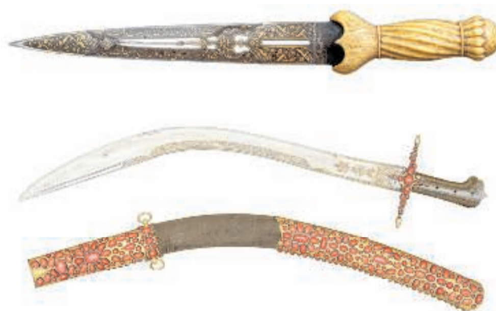
◀ Denne lille persiske dolk af hvalrostand bærer – modsat mange andre islamiske våben – ikke koranvers på klingens, men et kærlighedsdigt.