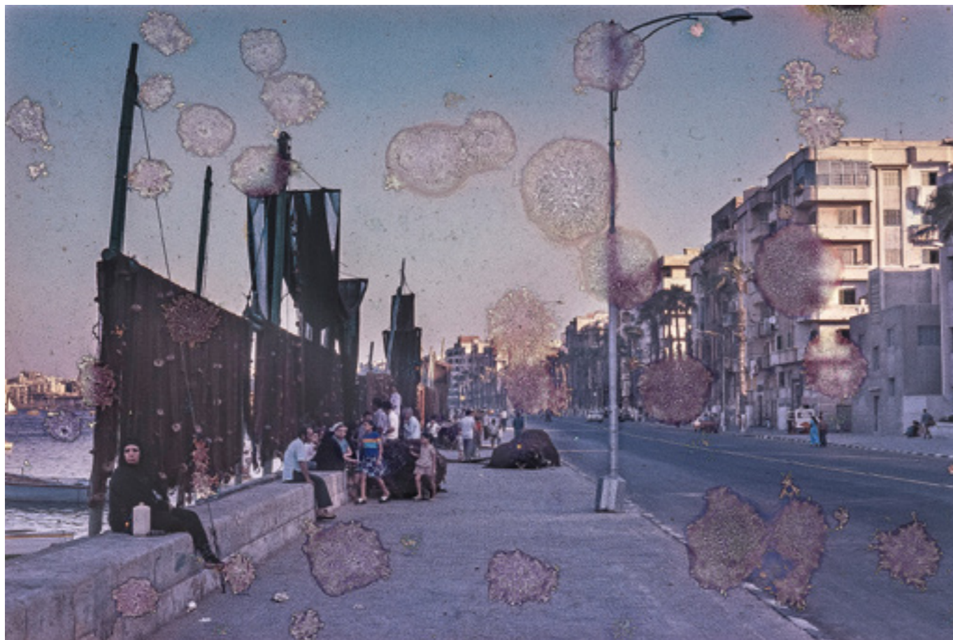
Fra særudstillingen Claus Rohland "Kun den rejsende er fremmed". Fotografiske indtryk af Mellemøsten

» der så noget absolut nyt og med det nye, kan også beskueren i dag opleve en simpel glæde over at se.