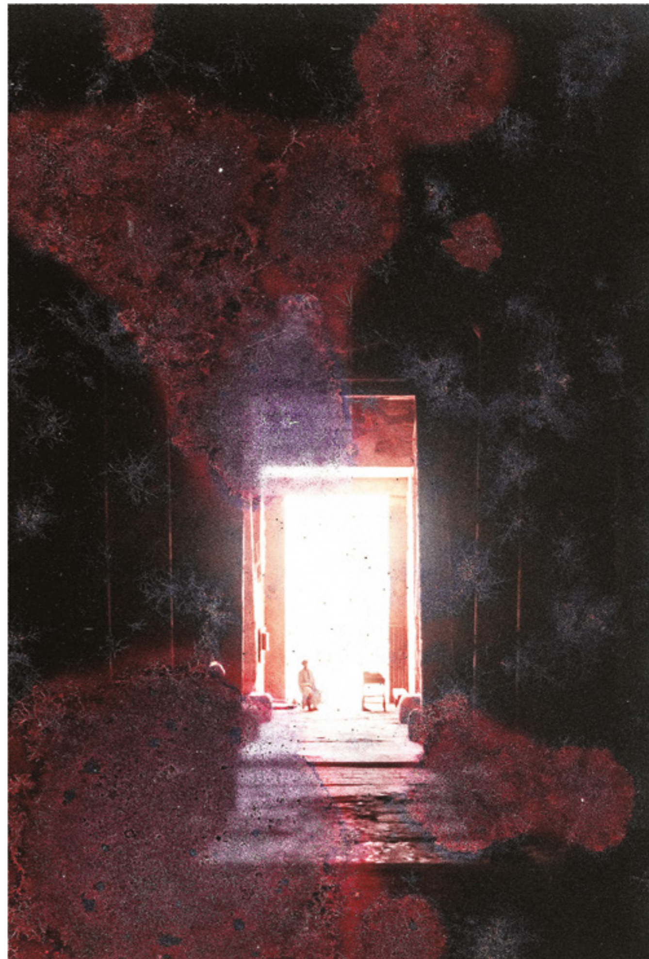
Fra særudstillingen Claus Rohland "Kun den rejsende er fremmed". Fotografiske indtryk af Mellemøsten

Davids Samling: Claus Rohland: Kun den rejsende er fremmed. Fotografiske indtryk af Mellemøsten 14. oktober 2022 – 9. april 2023