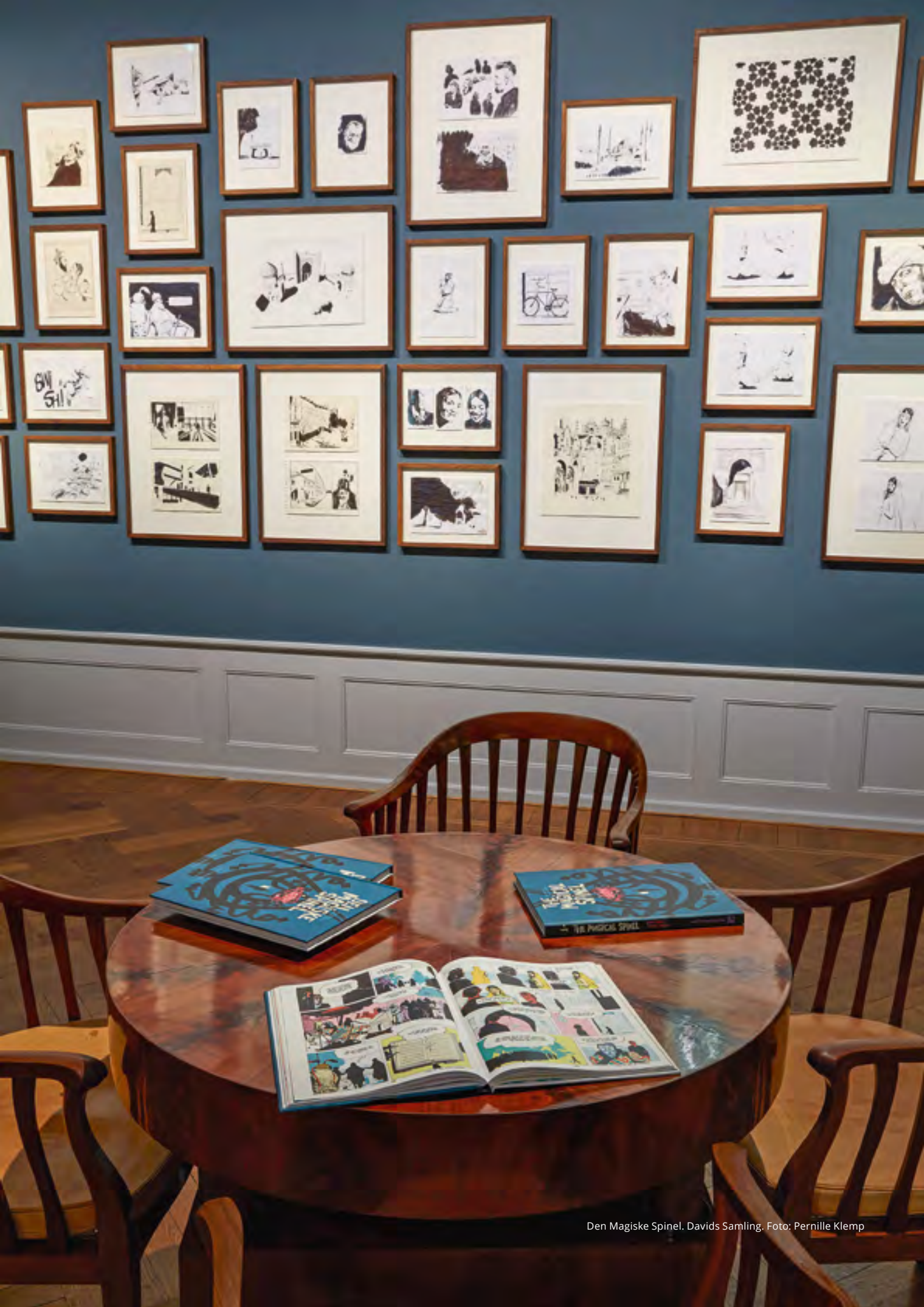
Den Magiske Spinel. Davids Samling.