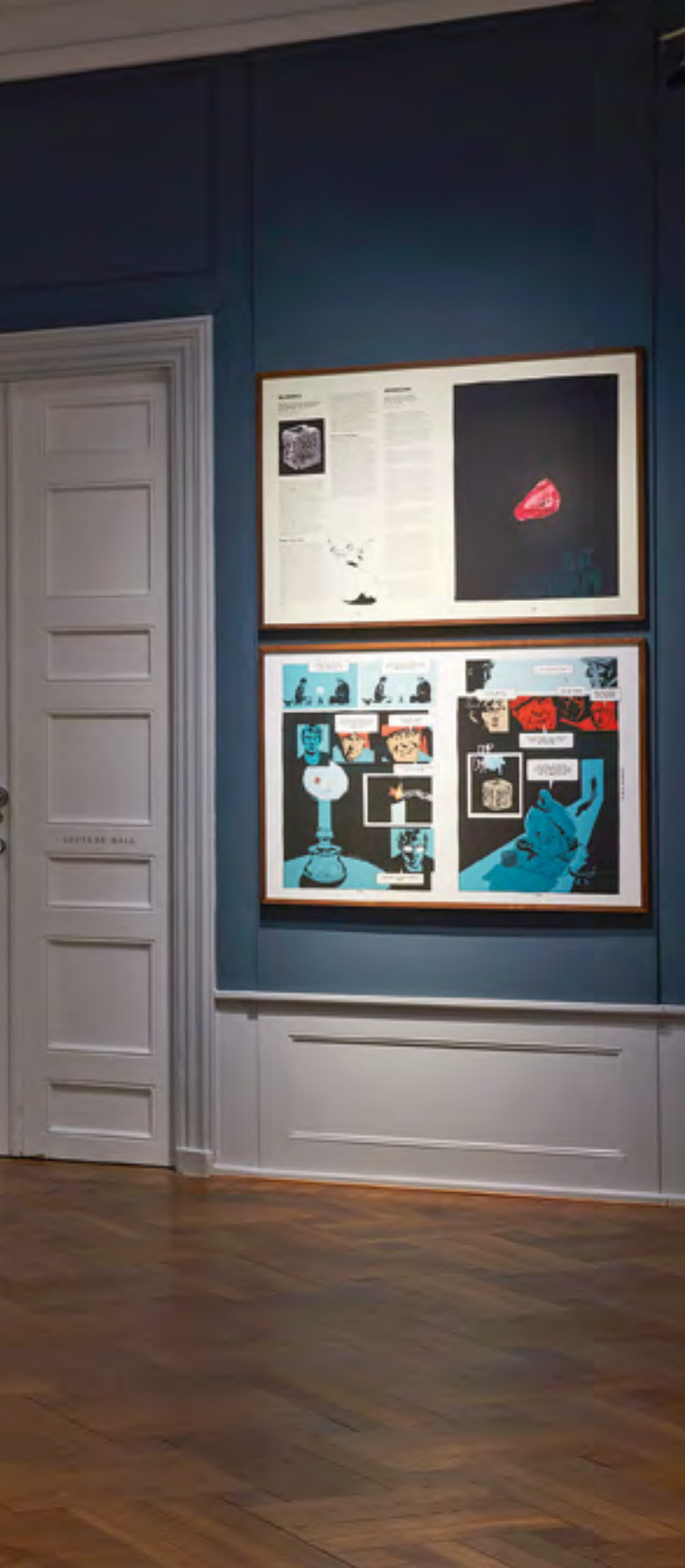
Den Magiske Spinel. Davids Samling.

Op ad trappen, i det mørkeblå rum på det smukke museum, Davids Samling, finder vi udstillingen Den Magiske Spinel. Et tværmedialt kunstværk på grænsen mellem magi og virkelighed, fortid og nutid. En levendegørelse af historiske kunstværker, der søger at gøre eventyret virkeligt og virkeligheden eventyrlig.