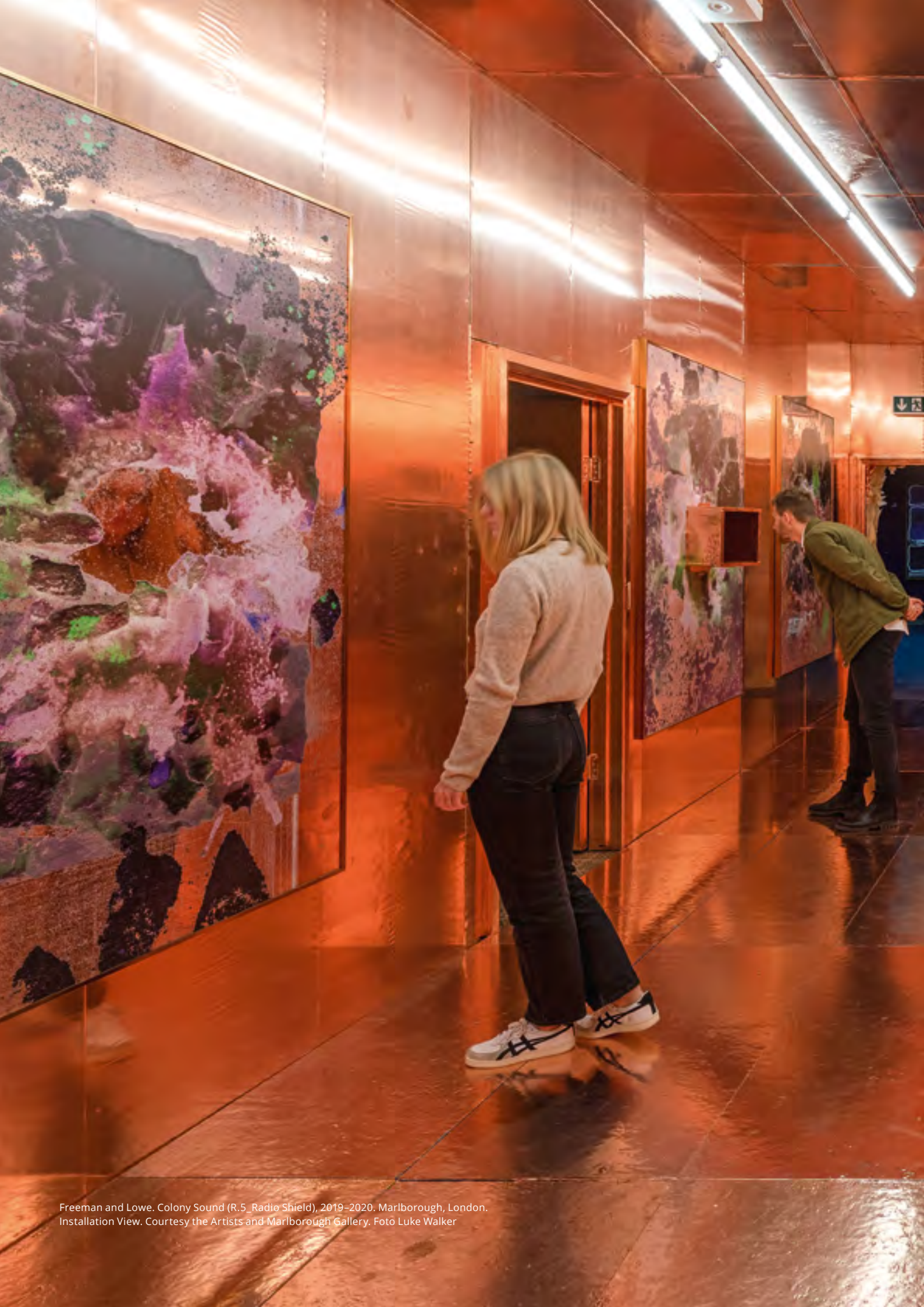
Freeman and Lowe. Colony Sound (R.5 Radio Shield), 2019–2020. Marlborough, London. Installation View.